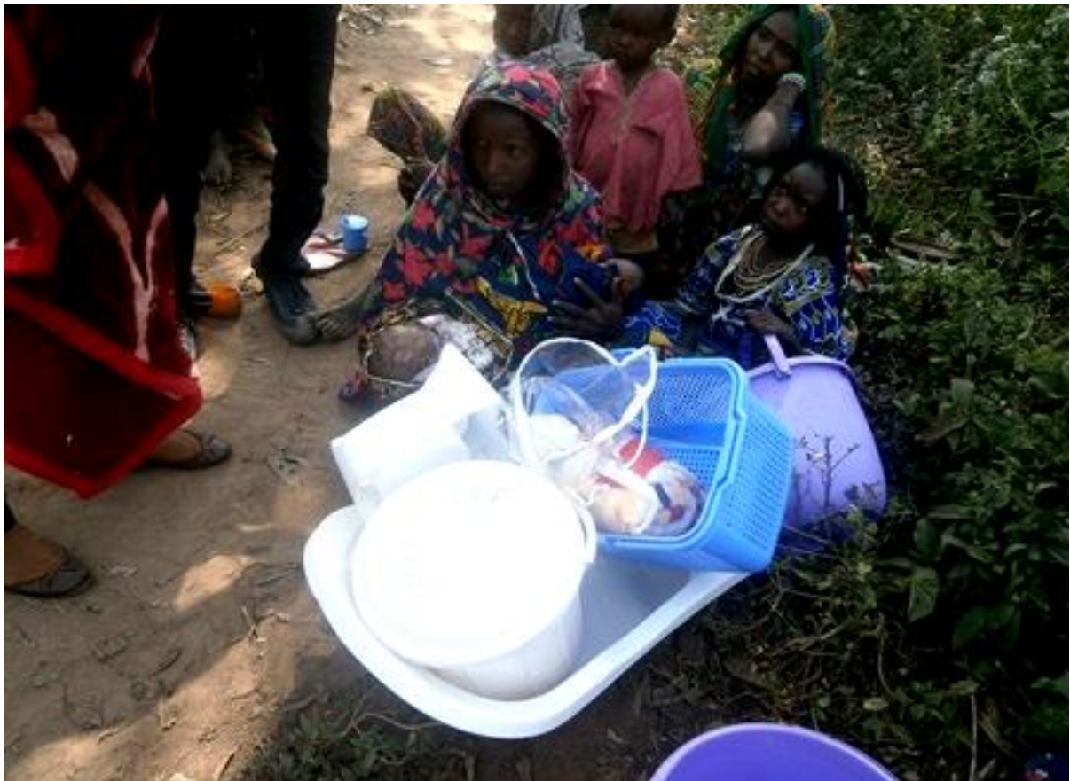
Figure 1. Femme allaitante bénéficiaire d'un kit